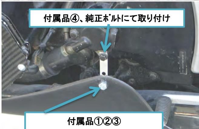
付属品④、純正ホルトにて取り付け

※FRP・カーボン製品の特性上、収縮によりホルト穴位置がずれることがあります。この場合、ヤスリ等で穴位置を修正してから取り付けてください。